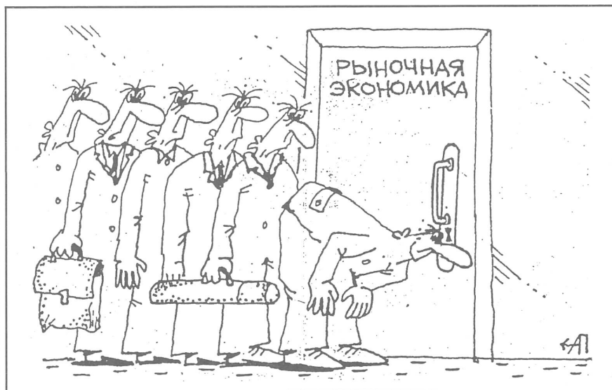
Marktwirtschaft. («Economika i schisn»), Moskau, Nr. 25/1990

Ungarn hat sich bereits im Herbst 1988 auch für Werbungtreibende aus dem Westen geöffnet, hier gilt die Werbung bereits als nicht mehr wegzudenkender Teil des Wirtschaftslebens. Insgesamt ist der Wachstumsmarkt im Vergleich zu den anderen Staaten Osteuropas derjenige mit der höchsten Entwicklungsstufe. Prinzipiell stehen alle