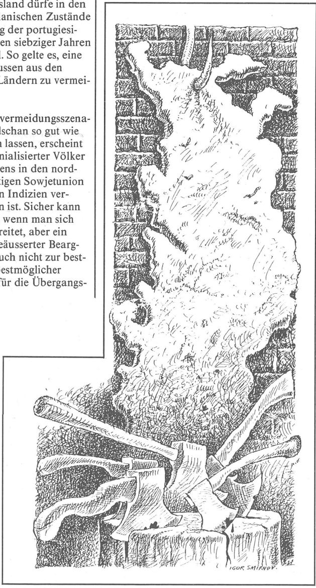
Balg (Sowjetunion) und Hackwerkzeuge. («Moskowskije Nowosti», Moskau, Nr. 35/1990).

Das alles betrifft in Solschenizyns Text eigentlich nur die Voraussetzung zur Schaffung jener Russischen Union, deren reichhaltig begründete Darlegung den eigentlichen Inhalt des Dokumentes bildet. Indessen ist diese Voraussetzung, der Abbau der jetzigen Sowjetunion, ein unmittelbares Haupttraktandum des jetzigen Geschehens, und Solschenizyn hat bei diesem Punkt schon Stoff zum Nachdenken zum mindesten den Russen gegeben, den willigen wie den widerwilligen. Christian Brügger