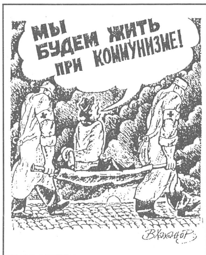
«Wir werden im Kommunismus leben!» ruft er und wird als Wahnsinniger abtransportiert. («Argumenti: fakti», Moskau, Nr. 24/1990)

Erst nachdem dies eingetreten war, konnten Gorbatschow und Jelzin das fällige «Bündnis» eingehen. Ryschkow ist relativ bedeutungslos für Gorbatschow, das heisst, er repräsentiert die mächtige, aber schon seit langem ohnmächtige Gruppe der Zehntausenden von Bürokraten. Auch deren Stunde hat mit dem Abbau der Zentralmacht beziehungsweise der Zentralplanung geschlagen.