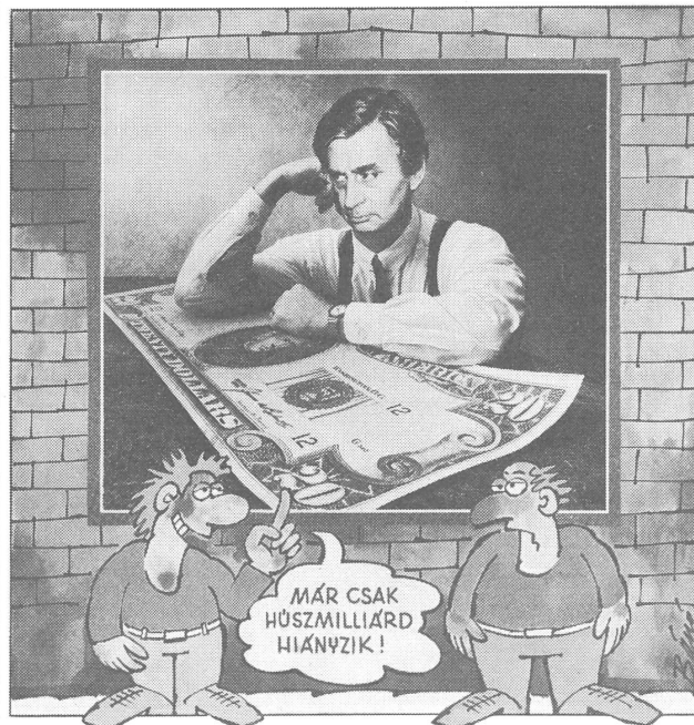
Die ungarischen Schulden: Jetzt fehlen uns nur noch 20 Millionen Dollar.» («Ludas Matyi», Budapest, 29. 8. 1990)

Auf dem erwähnten 14. Kongress vom Oktober 1989 kam die Umgestaltungspolitik der Partei zu ihrem Höhepunkt und ihrem Abschluss. Die sogenannten «Radikalreformer» siegten und wandelten die USAP in die USP um, die in ihren Schlussdokumenten die bisherigen kommunistischen Positionen auch formell aufgab. Sie sprach sich für ein Mehrparteiensystem mit parlamentarischer Demokratie aus, ferner für mehrere gleichberechtigte Eigentumsformen, wobei das Privateigentum auch an Produktionsmit-