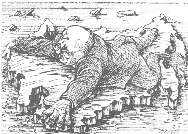
Die MN-Karikatur zu diesem Text

Aber der Unionsmarkt lässt sich nicht über Nacht schaffen. Solange neue gegenseitige Beziehungen im Lande lediglich im Anfangsstadium keimen, nähert sich die Zerstörung der alten Beziehungen ihrem Höhepunkt. Es wurde beschlossen, den Zerfallprozess durch die Erarbeitung eines neuen Unionsvertrages zu hemmen. Aber diese Idee, mit der sich die Radikalen noch