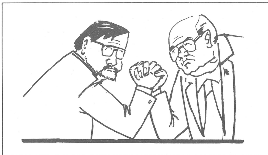
«Allunionswettkampf». Landsbergis und Gorbatschow in der Karikatur von «Dikobraz», Prag, Nr. 15/1990.