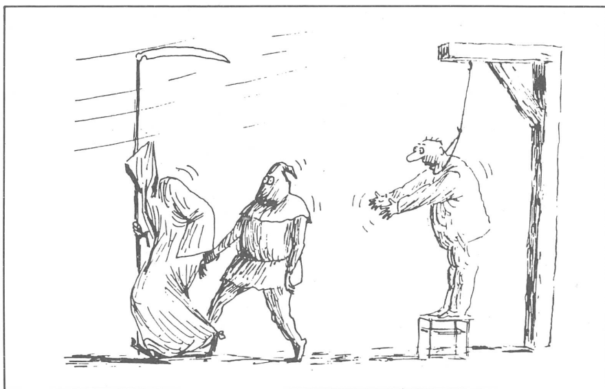
«Neue Zeit», Moskau, Nr. 23/1990

Die blosse Seele, die nicht denken muss, mag heute schon durch die Kirche belebt werden, durch die Rückkehr zum Heiligtum der Ahnen, durch das neue Vermögen der Erinnerung. Zur Belebung des Geistes aber braucht es mehr, den beweiskräftigen Sieg des ehrlichen Denkens. Früher, bevor die Geschichte Russlands eingefroren wurde, waren wir Menschen von Menschenart. Wir konnten sehen und hören, wir konnten Gutes vom Bösen unterscheiden. Heute bedarf es der geistigen Erschütterung, den verschütteten Geist wieder freizulegen. (...)