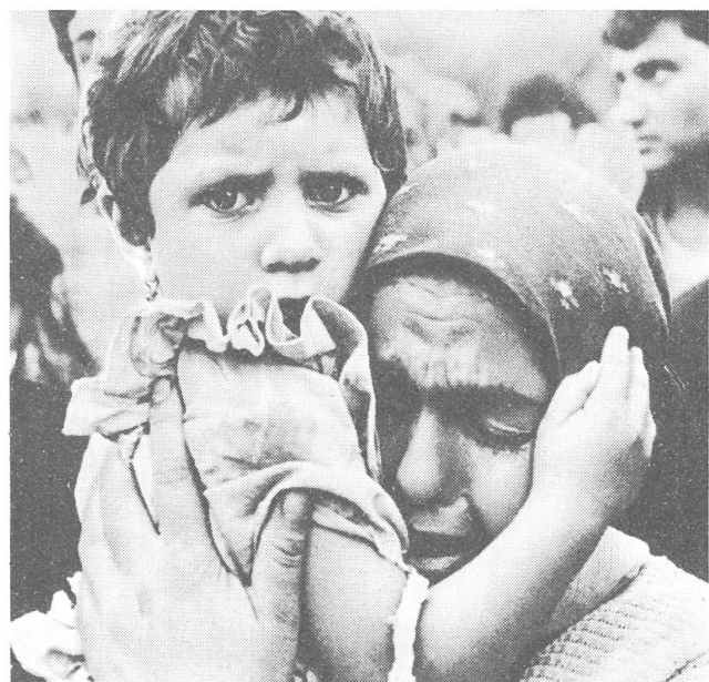
Innersowjetisches Flüchtlingslager in Usbekistan.