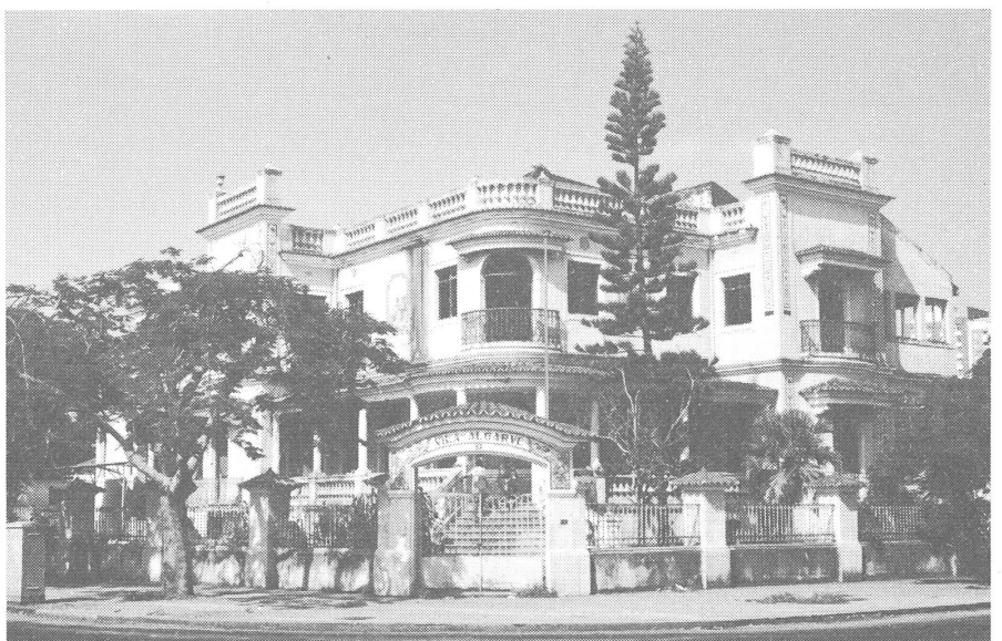
Von oben nach unten: Park über dem Indischen Ozean, Luxushotel Palana, ehemalige Villa.