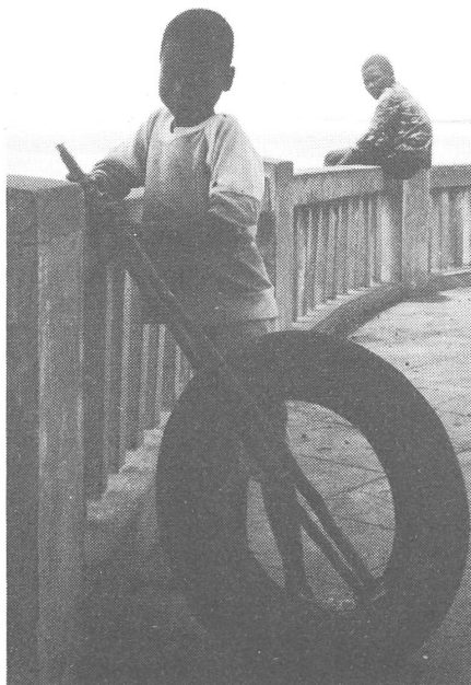
Kinder und vage Aussicht.

a) die Meinungsmacher in Südafrika pragmatisches Denken gegenüber Moçambique anwenden; das heisst, Moçambique sollte zuerst als Entwicklungsland und erst in