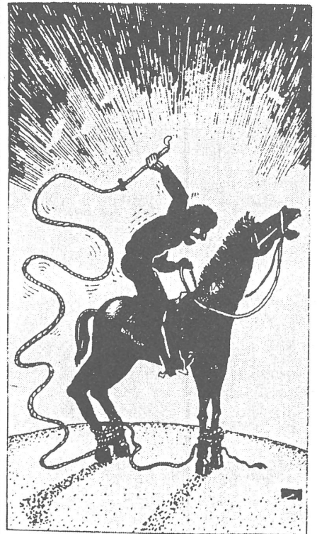
«Sputnik», Moskau, Nr. 3/1990