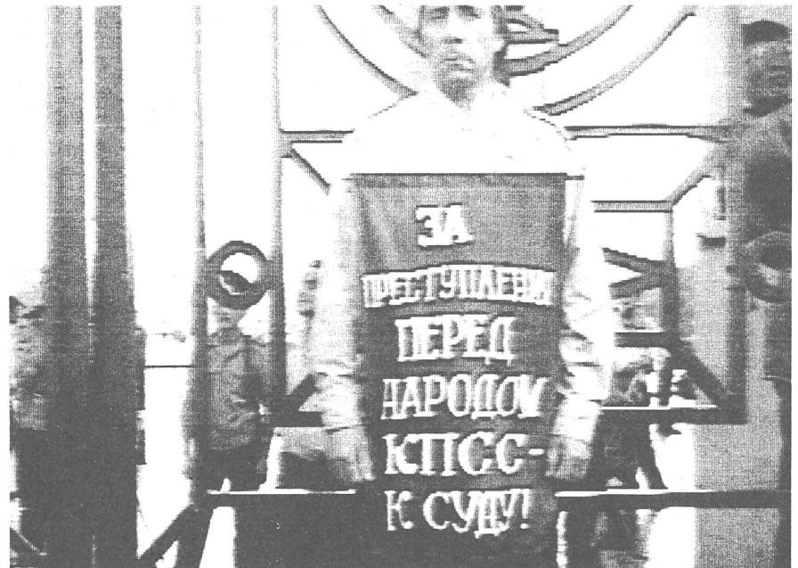
Kundgebung draussen während der Tagung des Parteikongresses. Auf dem Plakat steht: «Für Verbrechen am Volk gehört die KPdSU vor Gericht.» (Aus dem Moskauer Fernsehen vom 3. Juli)

Sambia vor dem Sturm? ..... 12 Ein weiterer Fall der «zweiten Revolution» in Afrika