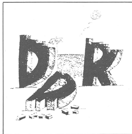
«Ludas Matyi», Budapest

Also unter uns: Es gibt schon ein paar Millionen Menschen, welche die aufgedeckte Stasi-Connection der RAF nicht verwunderlich finden. Die sattsam bekannten Ewiggestrigen. Bis gestern. Christian Brügger