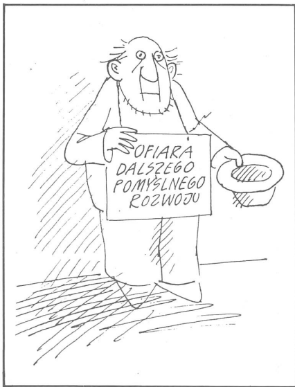
6 «Opfer der anhaltenden positiven Entwicklung» («Szpieki», Warschau, Nr. 42/1989)

Völlig untergegangen sind die ehemaligen Kommunisten. Sie haben zusammen mit ihren Verbündeten nicht einmal 1 % der Wähler hinter sich gebracht, trotz ihrer Umwandlung in eine Sozialdemokratische Partei. Dass sie von den gegenwärtigen Schwierigkeiten überhaupt nicht zu profitieren vermochten, zeigt das Ausmass der Absage an eine wie immer reformierte sozialistische Ordnung.