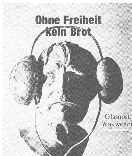
«Neue Zeit», Moskau, Nr. 9/1990.

Die ortsbezügliche Anregung, zum Beispiel litauische Studenten in St. Gallen studieren zu lassen, wurde übrigens vom Auditorium überaus lebhaft begrüsst, wie denn die schweizerischen Studenten auch auf die litauische Unabhängigkeit in Verbindung mit guten Kontakten zu den Russen besonders positiv reagierten. ■