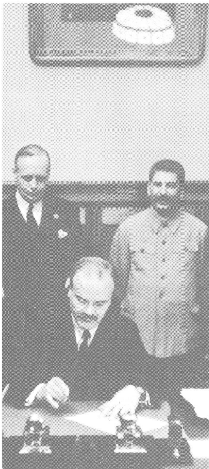
Molotow (sitzend), Ribbentrop und Stalin

Die Sowjetunion wurde also als Verteidiger des Friedens definiert, dagegen der deutsche Imperialismus als Kriegsauslöser bezeichnet, wobei Hitler nur die Rolle eines «Willensvollstreckers» zukam. Diese Definition war nicht ein Eigenprodukt der KP Schweiz, sondern ein Produkt der Analyse des