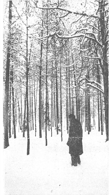
Iwan Titkow weist auf die Stelle, wo sich Massengräber der Ermordeten befinden.