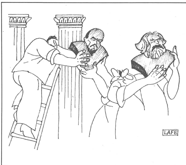
Das Frühlingsreinemachen findet dieses Jahr am 25. März (Wahltag) statt. («Ludas Matyi», Budapest, 14. 3. 1990)

Schliesslich ist der anstehende Systemwechsel logischerweise mit entsprechenden Existenzängsten von vielen Leuten verbunden. Was bringt der Übergang von der bequemen Planwirtschaft zur unbequemen Planwirtschaft mir selber? Das ist eine Frage, die sich Ärzte so gut stellen können wie Chauffeure und so weiter. Niemand ist sich sicher, seinen Schreibtisch oder seinen Arbeitsplatz zu