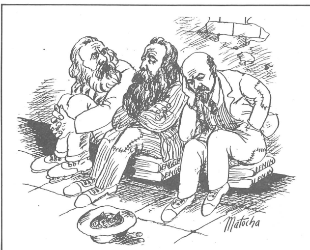
«Aber die Theorie ist richtig.» («Szpilki», Warschau, 15. 2. 1990)

Was passierte (und was sich angesichts der Umstände auch schon als zuviel erwies), war etwas anderes. Knapp drei Dutzend Armenier gelangten in die tadschikische Haupt-