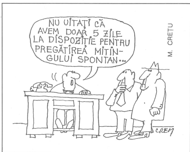
«Und wir haben nur noch 5 Tage zur Vorbereitung der spontanen Demonstration.» («Moful Roman», Nr. 2/1990)