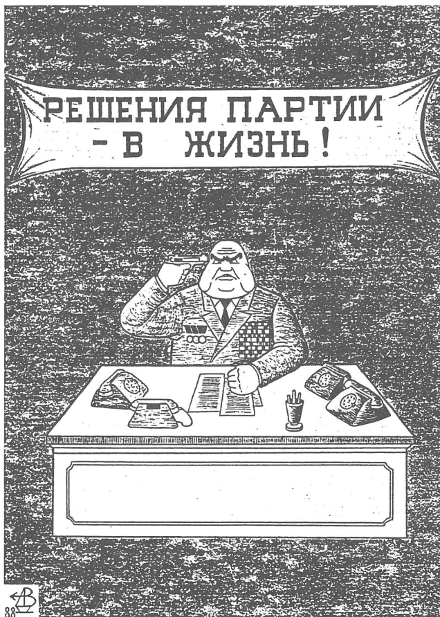
«Die Parteibeschlüsse gelten dem Leben!» («Ogonjok», Moskau, Nr. 4/1990.)

widerspricht zudem den früheren Ansprüchen auf eine spezifische «sozialistische Demokratie».