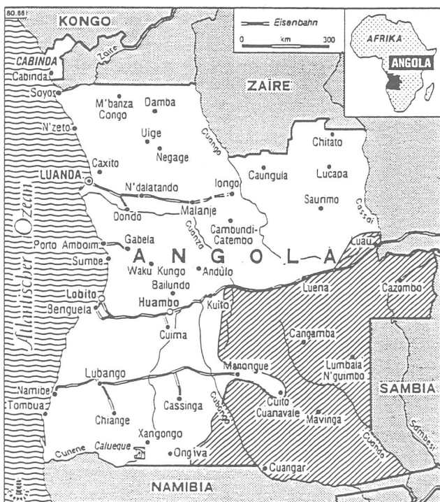
Angola – schraffiert das Unita-Gebiet.

Für die Widerstandsbewegung «ist die Wahrheit, dass Angola in jüngster Zeit der letzte Halt für alle sowjetischen Perestrojka-