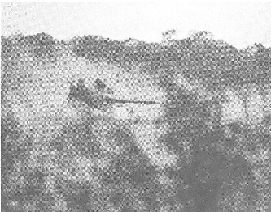
16 Panzer in Südafrika. (Aufnahme vom Verfasser)

Die «Unita leistet Widerstand», wie es in Jamba heisst, «um Verhandlungen führen zu können». Es gebe keinen anderen Ausweg «als einen Waffenstillstand, direkte Verhandlungen zwischen der Unita und der MPLA, freie Wahlen, eine Mehrparteiendemokratie und die Verwirklichung einer nationalen Versöhnung in Angola».