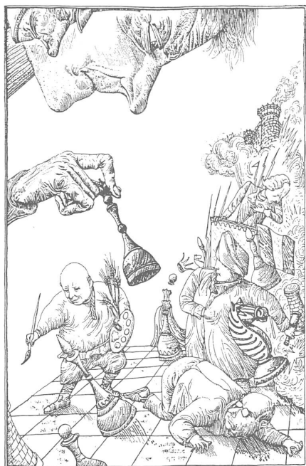
Die gesetzten Figuren wollen selber spielen. («Energija», Moskau, Nr. 11/1989)

Dominant sowohl in der ersten Gruppe als auch im osteuropäischen, sozialistischen Bereich überhaupt ist natürlich die Sowjetunion. Deren Reformbewegung steht vor zwei ganz grossen Schwierigkeiten: dem Nationalitätenproblem einerseits und der verschlechterten Wirtschaftslage andererseits.