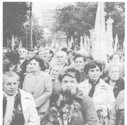
Demonstration der Unierten 1989.

Die Perestrojka ist in der Ukraine durch die Parteiführung in Kiew so lange gebremst worden als es nur ging. Letztes Jahr wurde diese wenigstens teilweise abgelöst, und seither sind sowohl die Perestrojka als auch der spontane Aufbruch von unten in Fahrt gekommen. Ruch und unierte Kirche sind die Hauptsymptome der neuen Zeit. Aber spürbar ist sie insgesamt. ■