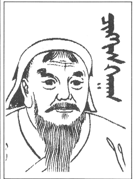
Dschingis-Khan ist rehabilitiert.