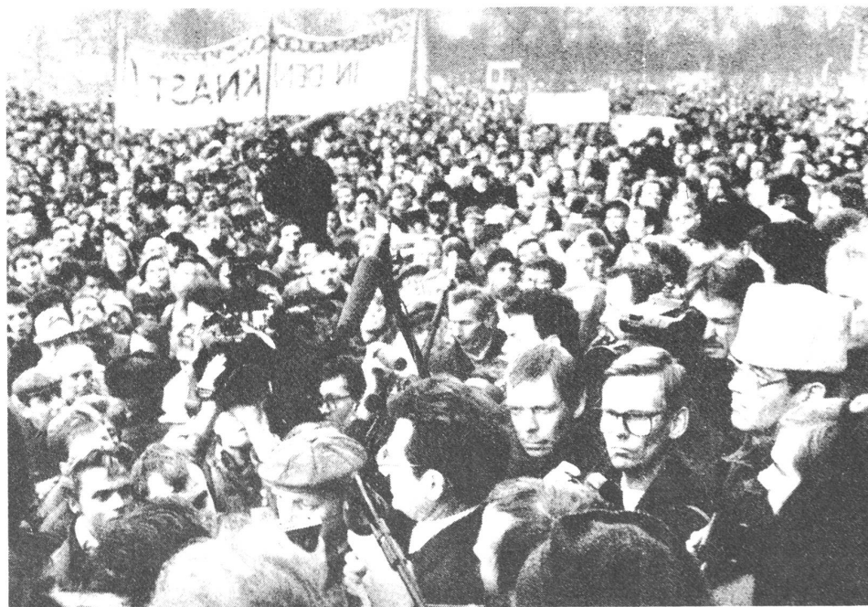
SED-Mitglieder fordern und erreichen am 3. Dezember den Rücktritt der Parteiführung.

Die Überlegung trägt zur Entkräftung des Vorwurfs an die Partei nichts bei. Wenn die SED als herrschende Kraft in Staat und Gesellschaft nicht nur die parteilose Bevölkerung betrogen hat, sondern auch die