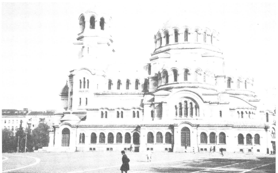
Alexander-Neviski-Kathedrale in Sofia.