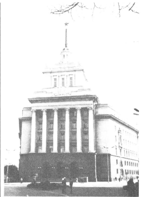
ZK-Gebäude in Sofia.

Empört über die im Westen kursierenden «Greuelmärchen» betreffend die «Auswanderer» zeigten sich im Gespräch auch die Mitglieder der parlamentarischen Kommission für die Verteidigung der Rechte der bulgarischen Bürger. Der Westen habe die Ziele des «Pantürkismus» noch nicht realisiert. Ginge es nach der Regierung in Ankara, so müsste jeder Moslem automatisch Türke sein. Frage man einen Bulgaren, was er sei, so antworte er entweder «ich bin Bulgare, Orthodox oder Muslim», aber nicht Türke. Und kategorisch von einem Kommissionsmitglied: «In Bulgarien gibt es keine türkische Minderheit, hat es nie gegeben; hingegen haben wir bei uns Bulgaren, die gewaltsam während der Türkenherrschaft auf dem Balkan gezwungen wurden, zu konvertieren!»