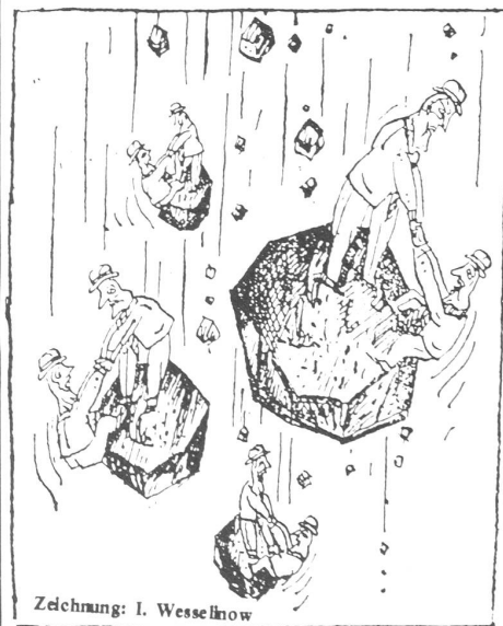
«Sofioter Nachrichten». 18. 1. 1989.