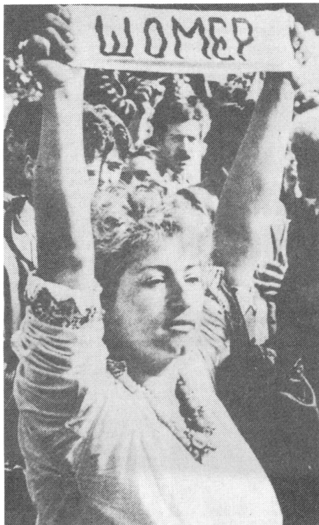
«Arbeitslos» heisst es auf dem Plakat, das eine moldauische Demonstrantin hochhält.

So beginnt der Text, mit dem die monatlich erscheinende deutsche Ausgabe (mit dem sprachlichen Mischtitel «Moskau News») von «Moskowskije Nowosti/Moscow News» (Nummer 10/1989) auf Seite 1 einen kombinierten Beitrag über die sowjetische Arbeitslosigkeit zusammenfasst. Wir bringen in grossen Auszügen den Haupttext, das Interview mit Igor Saslawski, einem Experten des Forschungsinstituts für Arbeit in Moskau. Das Gespräch führte Wladimir Gurewitsch.