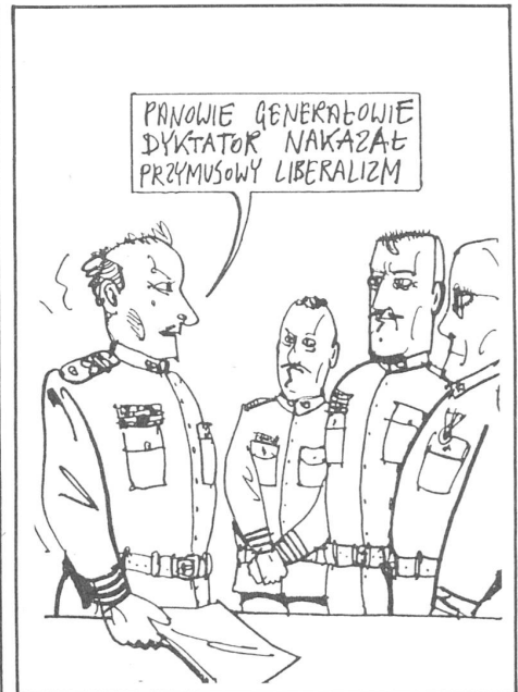
«Meine Herren, die Befehlsausgabe unseres Diktators lautet: <Liberalisieren, marsch!>» (Aus der Broschüre «Polnisch-polnische Gespräche» von Andrzej Mlecko, Krakau 1989)

Aber abgesehen von den Fragen zur Person ist die Besetzung eines solchen Postens im Informationswesen durch einen KOR- und Solidarnosc-Vertreter ein Indiz dafür, dass die politische Emanzipation des Landes weitergeht. Die VPAP (die demnächst ihren Namen ändern will), hat offenbar nicht einmal versucht, es auf die Kraftprobe eines Vetos ankommen zu lassen. Bohdan Gorski