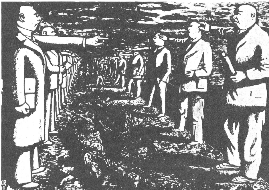
12 Beschuldigungsaustausch über Massengrab der Massakeropfer («Dekoriwnoje Iskustwo», Moskau, Nr. 2/1989)

1940 schlossen sich die drei baltischen Staaten – nach dem «Wahlsieg» der Kommunisten – der UdSSR an: Sie baten um Aufnahme in die UdSSR, was am 1. August 1940 auch erfolgte. Die baltischen Staaten haben also jetzt, 1989, auch diese historischen Gründe, für ihre Unabhängigkeit zu kämpfen. ■