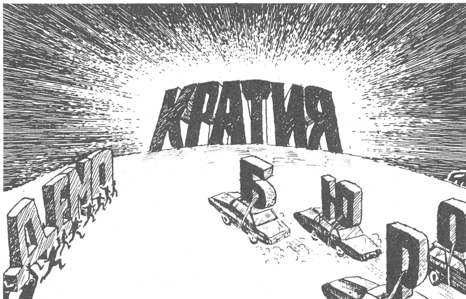
Die Demokratie trippelt, und die Bürokratie fährt zur «Kratie», zur Herrschaft. («Ogonjok», Moskau)

Die Ostdeutschen haben von der Bevormundung durch ihren Staat genug. Sie schauen auf ihre westdeutschen Landsleute, welche grösstmögliche Freiheiten geniessen und erst noch in einem Wohlfahrtsstaat mit sozialen Sicherheiten leben. Der Vorsprung, den der sozialistische Staat früher wenigstens auf diesem Gebiet hatte, ist schon längst verschwunden, und sämtliche Vergleiche fallen zu seinen Ungunsten aus, nicht zuletzt die ökologischen Vergleiche. Der Zustand der Umwelt ist im Westen schlimm, aber im Osten ist er katastrophal.