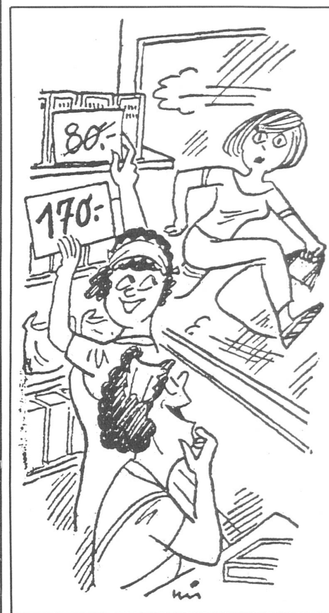
Die galoppierende Inflation. «Nein, wart noch. Stell den neuen Preis erst hin, wenn sie am Verkaufstisch ist.» («Express Wieczorny», Warschau 16. 8. 1989)