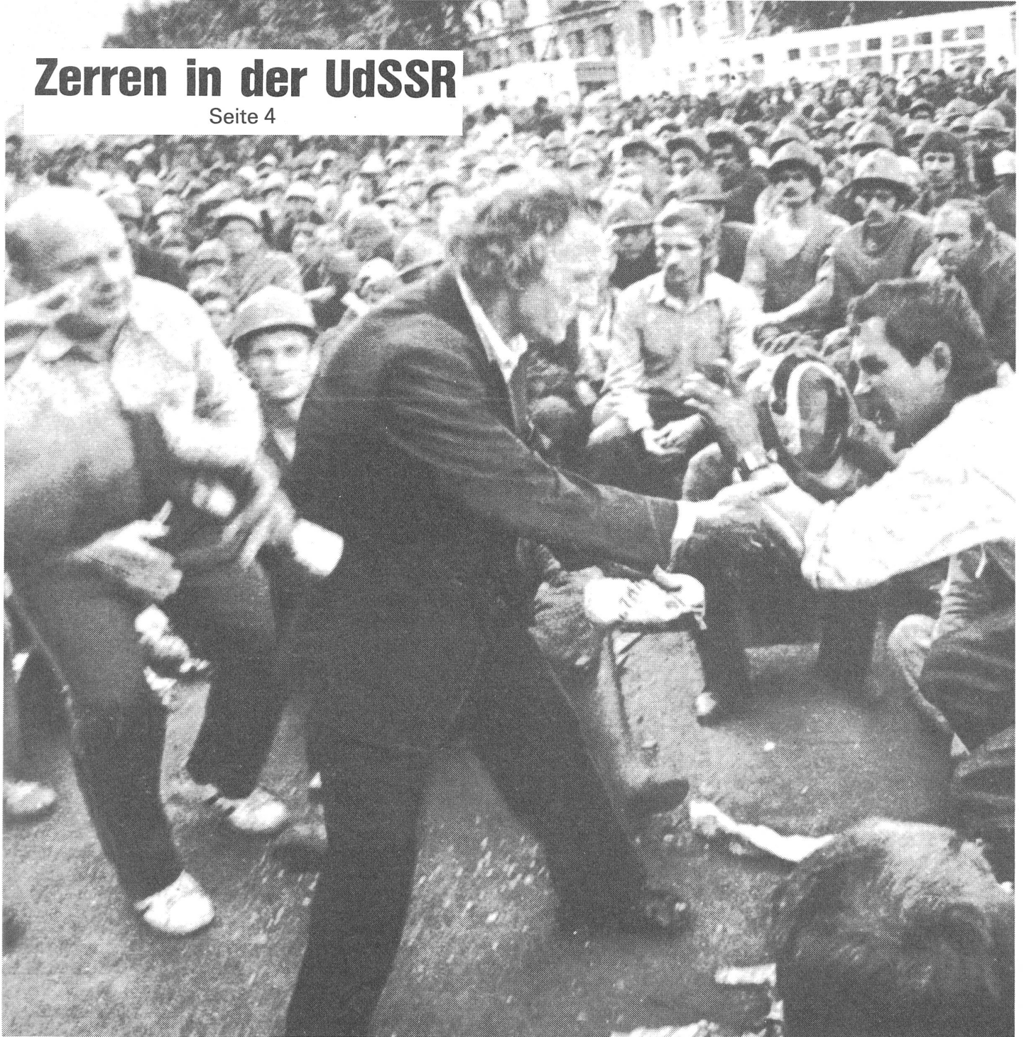
Streikszenen in Kusbass.