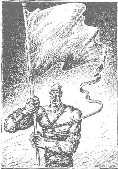
Karikatur aus «Szpilki», Warschau, Nr. 32/1989

Lech Walesa überliefert: «Wir werden Polen in ein zweites Japan umwandeln.» Heute lässt sich die Solidarnosc nicht gerne daran erinnern.