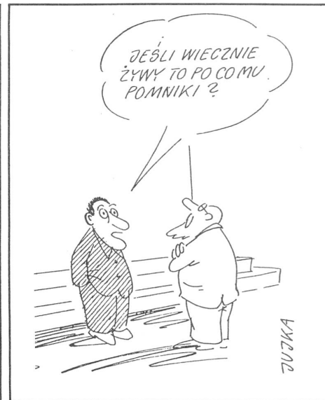
«Wenn er (Lenin) doch ewig lebt, wozu setzt man ihm denn Denkmäler?» («Szpilki», Nr. 17/1989)

Zu den latenten Problemen treten noch akute Sorgen mit jenem Teil der Jugend, der