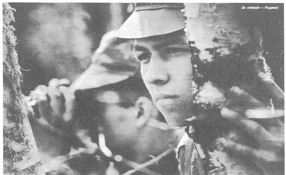
Hat bei der Jugend an Ansehen verloren: das Militär. («Ogonjok», Moskau)