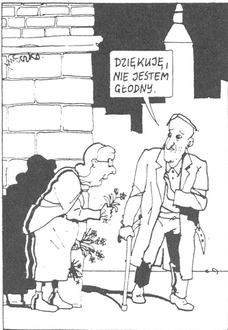
«Danke, aber ich habe keinen Hunger.» («Prze glad tygodniowy», Warschau, Nr. 17/1989)

Schliesslich zeugt es von wenig Vertrauen in die Demokratie, den neuen Parteien quasi schon vor ihrer Geburt die Lebensfähigkeit abzusprechen. Es werden natürlicherweise christlichsoziale und christlichdemokratische Parteien entstehen, wahrscheinlich auch sozialistische und nationalistische. Weshalb soll das schlechter sein als eine künstlich vereinigte und künstlich zusammengehaltene Oppositionspartei? Unter der einzigen Bedingung, dass man ihnen ihre Tätigkeit überhaupt gestattet, werden sich die Parteien so entwickeln, wie das in einer parlamentarischen Demokratie normal ist, in jeweiligen Koalitionen für jeweilige Perioden, immer die Quittung ihrer Wähler vor Augen. Und sie hätten erst noch etwas, was die Parteien in andern Ländern nicht haben: das allen