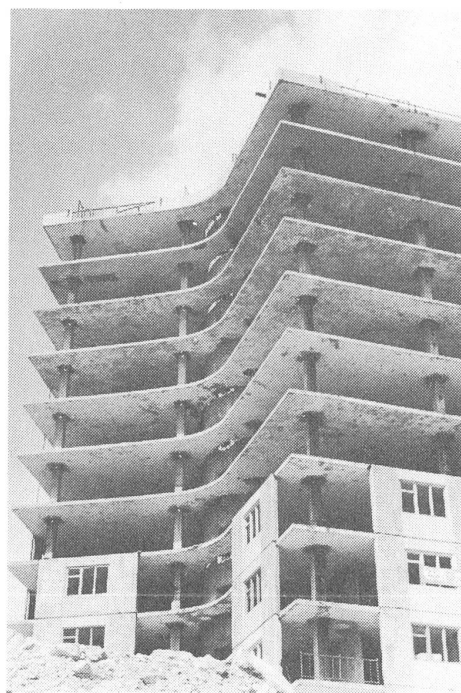
Vom Autor 1969 in Jerewan aufgenommen. Links entsteht ein Wohnblock in konventioneller Bauweise, rechts ein Wohnblock von erdbebensicherer Konstruktion – im Prinzip.