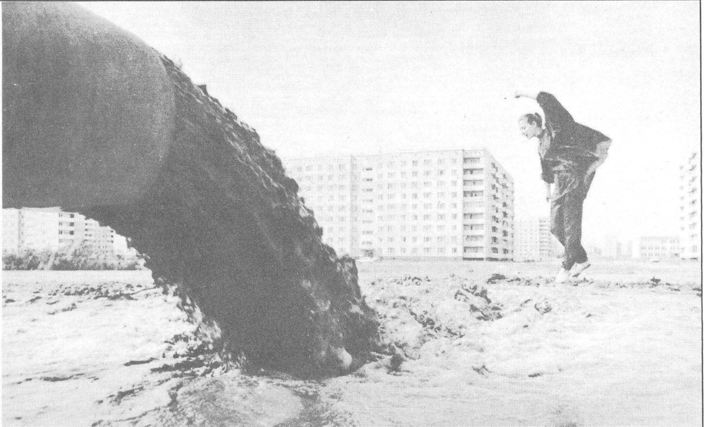
Gegensätze in Omsk. («Ogonjok», Moskau, Nr. 40/1989)

Im europäischen Teil des Landes hat man mit Stauanlagen 2600 Dörfer und 165 Städte überflutet. Den Böden Sibiriens hat man mit Raubernten 35 Millionen Tonnen Nährstoffe entzogen und 9 Millionen Tonnen zurückgegeben. Im Gebiet der Kalmüken ist die erste Sandwüste Europas entstanden. Sie umfasst heute 500 000 Hektaren und vergrößert sich jährlich um 50 000 Hektaren.