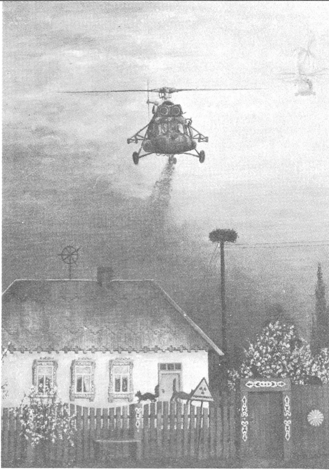
Sprühender Helikopter. Gemälde von Valeri Bobkow. («Ogonjok», Moskau, Nr. 43/1988)