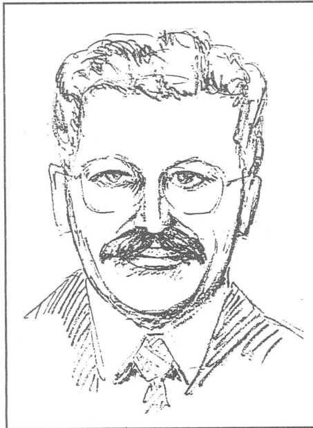
Ronuald Szeremietiew (Zeichnung von Max Keller)

Demokratie mit freien Wahlen. Notwendig ist auch eine Regierung, die das Vertrauen des Volkes genießt. Eine solche Regierung nun kann nicht gebildet werden aufgrund von Verhandlungen zwischen Kommunisten und willfährigen Oppositionellen. Die beste Klarstellung über die Absichten der Partei wäre die Antwort auf die Frage, ob sie bereit ist, auf Repression und Terror zu verzichten, ob sie bereit ist, die Alleinverfügung über Polizei und Armee aufzugeben. ■