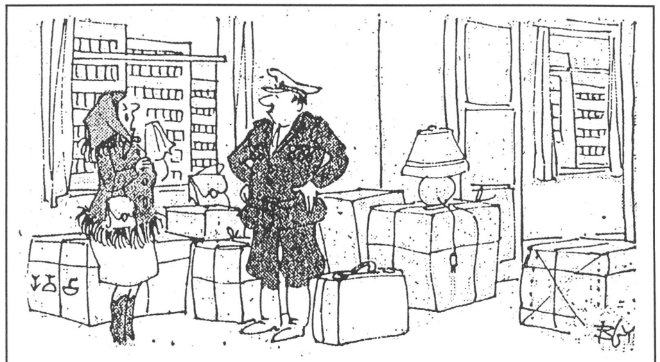
Der Abzug sowjetischer Truppen aus Ungarn: «Siehst du, Sergej, ich rede schon seit 40 Jahren davon, dass wir hier nur vorübergehend stationiert sind...» («Budapester Rundschau», Budapest, Nr. 3/1989)

Ein wichtiger Punkt betrifft die Schwerindustrie, für die Ungarn bei jeglichem System das falsche Land wäre. Nach der kommunistischen Machtübernahme zwang man Ungarn - wie damals alle osteuropäischen Länder - zum Aufbau einer autarken Wirtschaft mit allen erdenklichen Zweigen der Schwerindustrie, mit Eisen- und Stahlproduktion, wiewohl es ein energiearmes Land ist und auch Eisenerz importieren muss. Die