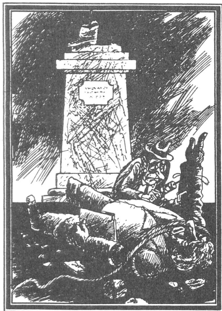
«Moscow News», Moskau, Nr. 25/1988

Knabe, mehrere Frauen. Wollen wir versuchen, das Dekret über die «Entkosakisierung Russlands» zu vergessen? Mit diesem Erlass wurde den «besonderen Abteilungen» die vollständige Vernichtung der Kosaken samt Frauen und Kindern aufgetragen; eine Million toter Kosaken waren die Folge. Ferner gibt es Angaben, wonach vor der Revolution in Russland 360 000 Priester lebten; Ende 1919 blieben 40 000 übrig. Sollen wir das alles vergessen? Oder so tun, als sei das nicht geschehen? Oder für jeden Fall separate Denkmäler aufstellen?