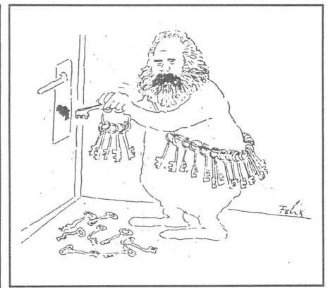
«Szpilki», Warschau, Nr. 47/1988

Das schafft das Dilemma der Solidarnosc nicht aus der Welt. Aber es macht klar, dass die Hüter der bestehenden Ordnung nichts zu liefern haben ausser Rückzugsefekte. Dass die Polen, die in ihrer immer mieser werdenden materiellen Situation dort und