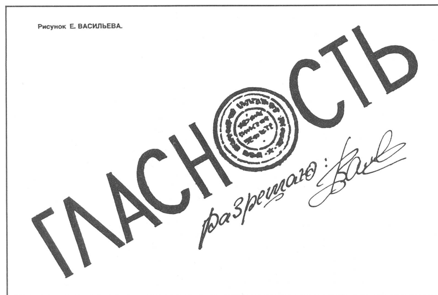
Glasnost mit Stempel «Genehmigt». («Krokodil», Moskau, Nr. 34/1988)