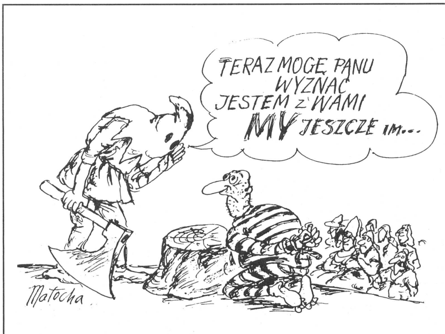
4 «Jetzt kann ich es Ihnen vertraulich sagen: Ich bin auf eurer Seite. Denen da oben werden wir es zeigen...» («Szpilki», Warschau, Nr. 49/1988)

In Polen ist der Wohnraum knapp. Ende 1987 gab es laut «Rzeczpospolita» auf 22 Millionen Erwerbstätige 2 280 000 Wohnungssuchende, und auf eine Wohnung muss man Jahre warten. Die durchschnittliche Fläche einer Wohnung beträgt 50 m 2 , die durchschnittliche Belegung drei Personen.