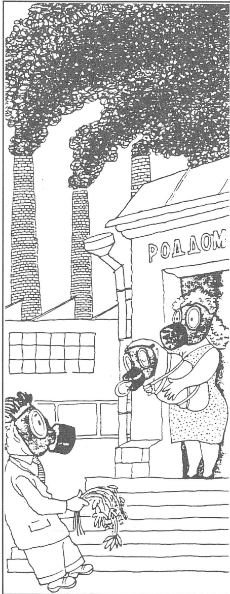
Aus der Entbindungsstation in die Umwelt. («Krokodil», Moskau, Nr. 19/1988)

Obersten Sowjets hatte der sowjetische Planungschef Jurij Masljukow erklärt: «Bis jetzt erreicht kaum ein Drittel des angebauten Gemüses den Verbraucher, an Kartoffeln geht eine noch grössere Menge verloren.» Dazu eine Vergleichszahl aus dem Westen: In Bayern rechnet man einen Laden oder Stand mit Obst und Gemüse auf 800 bis 1000 Einwohner.