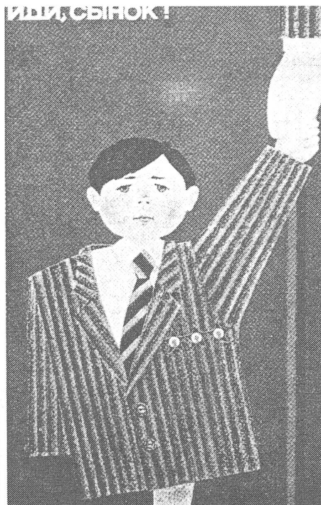
«Geh voran, mein Sohn!» («Isobrasitenoje Iskustwo», Moskau, Nr. 11/1988)

verringerte sich um 52 %. Seit 1986 nimmt auch die Zahl der Alkoholkranken langsam ab. Anfang 1988 waren 4,8 Millionen Sowjetbürger, die an chronischem Alkoholismus leiden, bei den Gesundheitsbehörden gemeldet.