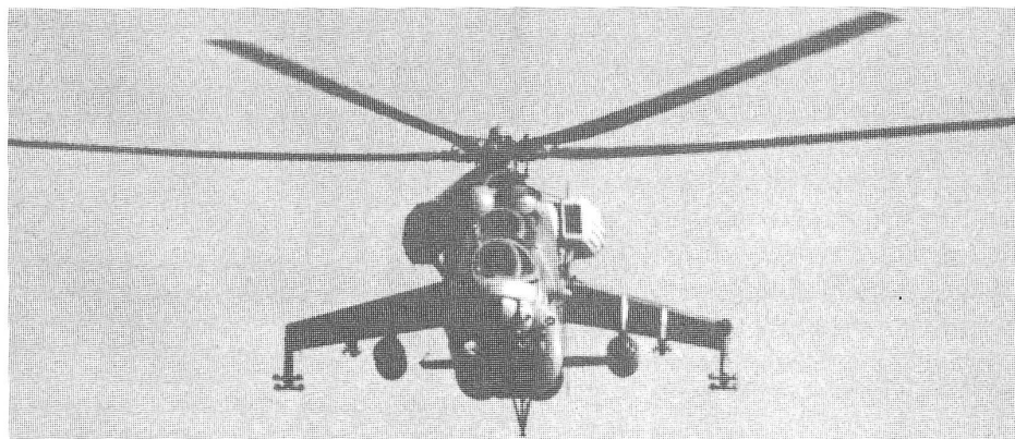
Sowjetischer Kampfhelikopter MI-24.

Die Beilage kann direkt bestellt werden beim Afghanistan-Archiv, Benzburweg 5, 4410 Liestal. ■