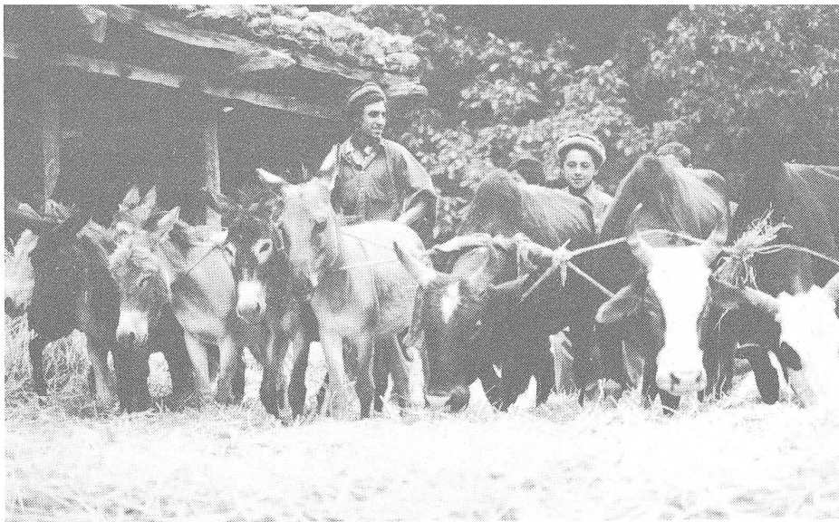
So wird der Weizen gedroschen.

Wasser) sind verschüttet, Siphons (Röhren) sind zerdrückt, Äquidukte zerbombt und/oder eingestürzt. Ein mittleres Karez zu regenerieren kostet laut Gerd Kellermann vom ARC (Austrian Relief Committee) zwischen 20 000 und 50 000 pakistanische Rupien, was 3000 bis 3500 Franken entspricht.