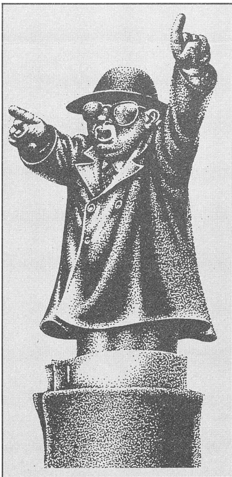
Die neue Pflege des Monuments hat Sprengwirkung. (Karikatur ohne Worte aus «Ogonjok», Moskau, Nr. 42/1988)

Schtscherbizki. Die Haltung der übrigen fünf ist schwer auszumachen. N. I. Ryschcow ist Ministerpräsident; er und N. N. Sljunktow gelten als Technokraten und Anhänger rascher Wirtschaftsreformen, sind aber zögernd bezüglich politischer Reformen. V. P. Nikonow wurde 1987 ins Politbüro berufen und verhält sich loyal zum Generalsekretär, dürfte aber eher der konservativen Richtung zuzuzählen sein. V. I. Worotnikow gilt bezüglich politischer Reformen als zurückhaltend. L. N. Sajkow, Nachfolger Jelzins als Chef der Moskauer Parteisektion und Sekretär im Zentralkomitee (ZK) scheint eher Ligatschow als Gorbatschow nahestehen. Es könnte sein, dass er zur Nummer 2 aufrückt.