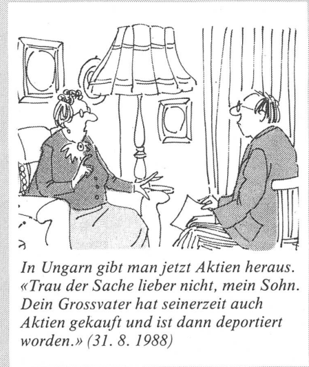
In Ungarn gibt man jetzt Aktien heraus. «Trau der Sache lieber nicht, mein Sohn. Dein Grossvater hat seinerzeit auch Aktien gekauft und ist dann deportiert worden.» (31. 8. 1988)