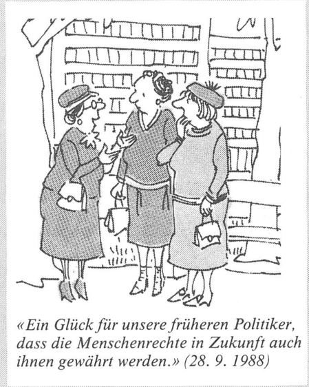
«Ein Glück für unsere früheren Politiker, dass die Menschenrechte in Zukunft auch ihnen gewährt werden.» (28. 9. 1988)