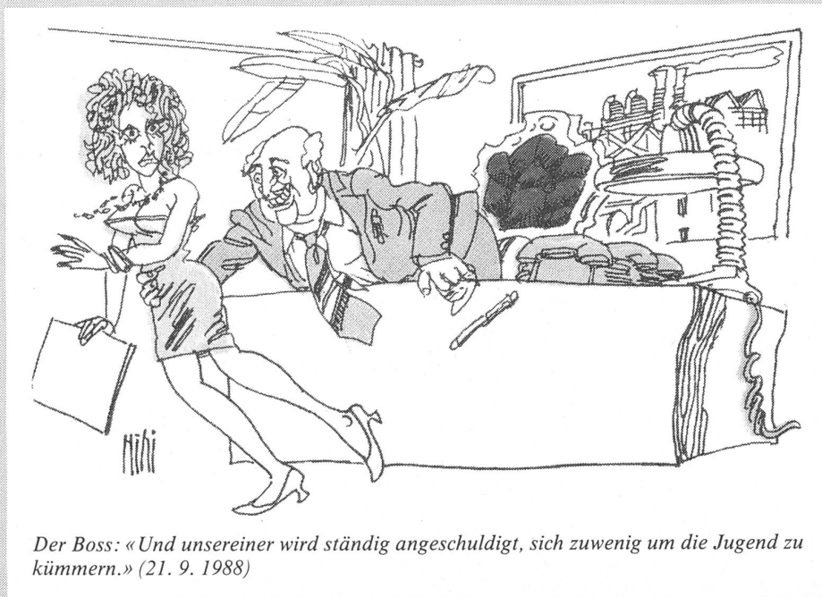
Der Boss: «Und unsereiner wird ständig angeschuldigt, sich zuwenig um die Jugend zu kümmern.» (21. 9. 1988)