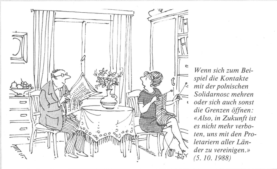
Wenn sich zum Beispiel die Kontakte mit der polnischen Solidarnosc mehrten oder sich auch sonst die Grenzen öffnen: «Also, in Zukunft ist es nicht mehr verboten, uns mit den Proletariern aller Länder zu vereinigen.» (5. 10. 1988)