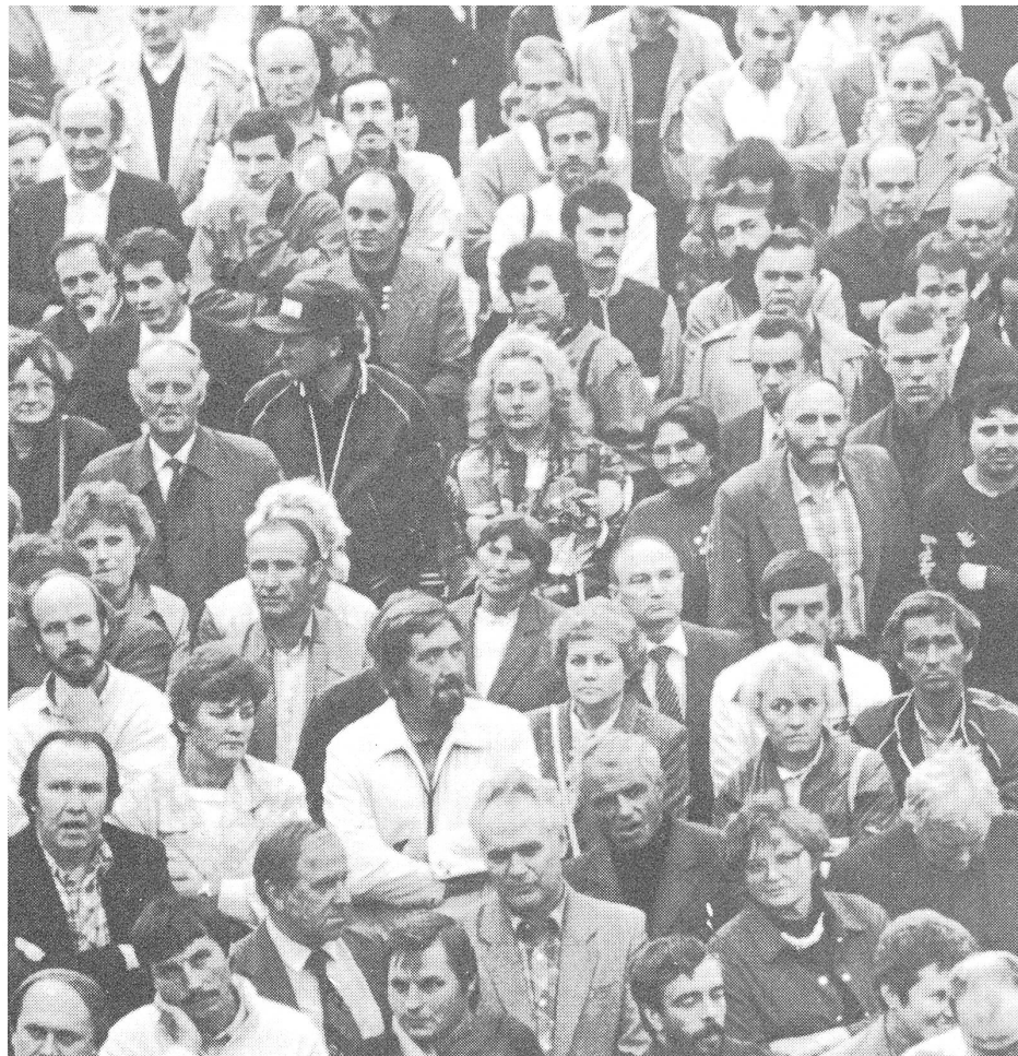
Volksfront-Kundgebung in Tallinn.

Oder schon in Bejahung einer demokratisch geteilten Macht in der Zukunft? Die Volksfront hat – vorläufig unwidersprochen – ihre Absicht bekanntgegeben, bei kommenden Wahlen eine eigene Kandidatenliste aufzustellen, und wenn das umgesetzt würde, wäre eine qualitative Änderung des politischen Systems bereits geschehen: Statt der bisher schon als Neuerung gebilligten Auswahl an gleichgesinnten Kandidaten hätte man alternative Möglichkeiten, selbst wenn sie einstweilen noch nicht als solche deklariert sein sollten. Christian Brügger