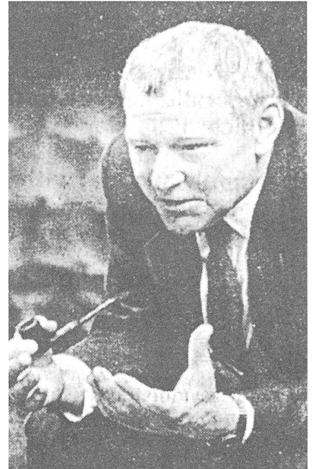
Politbüro-Mitglied Mieczyslaw Rakowski warnt davor, dass die Solidarnosc darauf aus sei, die verfassungsmässigen Strukturen des Landes zu sprengen. Vom Bedürfnis nach einer neuen Verfassung spricht er noch nicht. Und wie verfassungsmässig war denn das Kriegsrecht von 1981?

Hier besteht an sich eine grosse Zone des Zweifels, aber das vorläufige Fazit sieht nach ei-