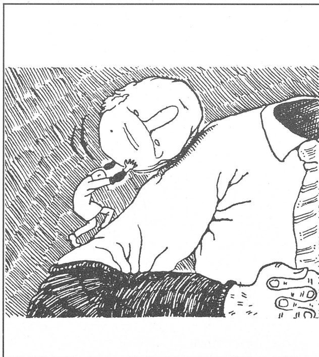
«Iswestija», Moskau, 15. 8. 1988